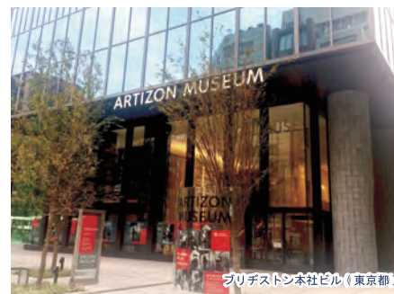
プリチストン本社ビル(東京都)