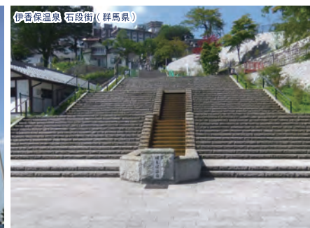
伊香保温泉 石段街(群馬県)