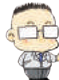
サンポウ非公認ゆるきゃら ヒデもん