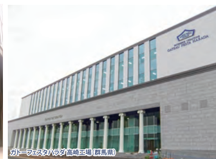
カトーシェスタハダ高崎工場(群馬県)