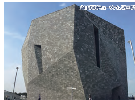
角川武蔵野ミュージアム(埼玉県)