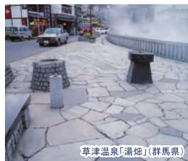
草津温泉「湯畑」(群馬県)