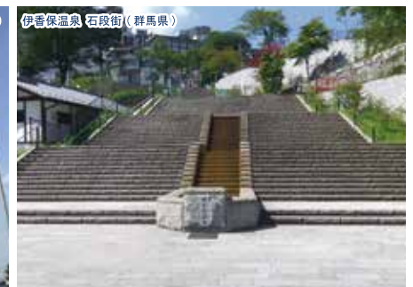
伊香保温泉「石段街」(群馬県)