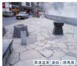
草津温泉「湯畑」(群馬県)