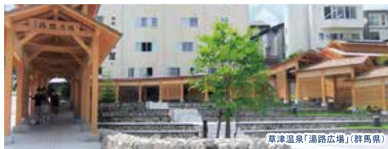
草津温泉「湯路広場」(群馬県)