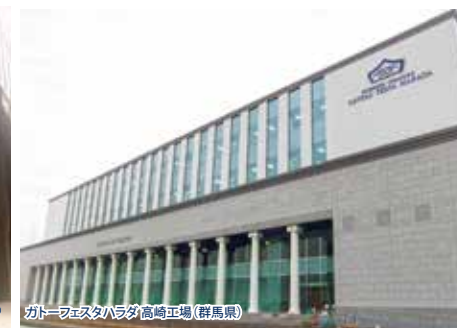
カトーウェスタハラタ高崎正場(群馬県)