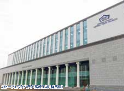
ガトーフェスタハラダ高崎工場(群馬県)