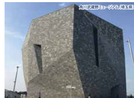
角川武蔵野ミュージアム(埼玉県)