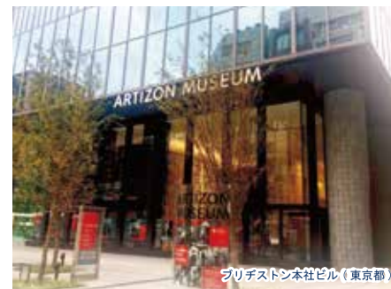
ブリヂストン本社ビル(東京都)